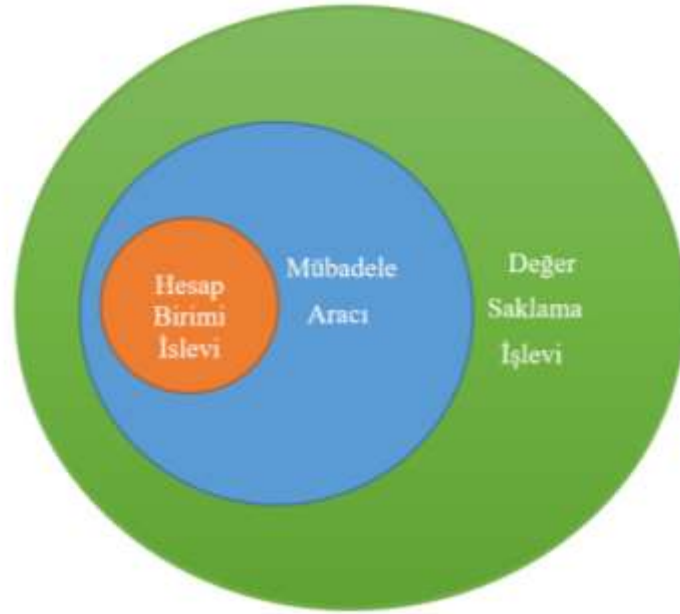
Şekil 2.1: Paranın İşlev Hiyerarşisi

Paranın ödemelerde sürdürülebilir bir şekilde kullanılabilmesi için geçmişten geleceğe alım gücünü koruması gerekir. Para kazanıldığı andan harcadığı zamana kadar değerini korumalıdır. Paranın bu işlevleri hiyerarşik bir şekilde çalışır (Şekil 2.1). Her değer saklama aracı değişim aracı olamayacağı gibi her değişim aracı da ölçü birimi olmayabilir. Sahip olduğumuz konutu ele alacak olursak değer saklama aracı olmakla birlikte bir değişim aracı değildir. Değişim aracı olarak nitelendirilen bir varlığın değer saklama aracı olması ise zorunludur. Şekil 1’den hareketle bir şeyin ölçü birimi olarak kullanılabilmesi için aynı zamanda değer saklama aracı ve değişim aracı olması gerekmektedir. Ölçü birimi olma özelliği yani değer biçme, fiyatlandırma özelliği paranın temel fonksiyonu, paranın bir buluş olarak ortaya çıkma nedenidir. Bununla beraber en önemli özelliği genel kabul gören bir değişim aracı olmasıdır (Afşar vd., 2012:30; Özatay, 2013:29).