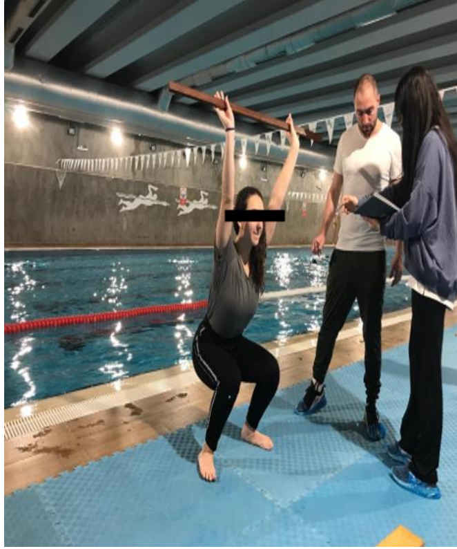
Resim 3.1: Derin çömelme