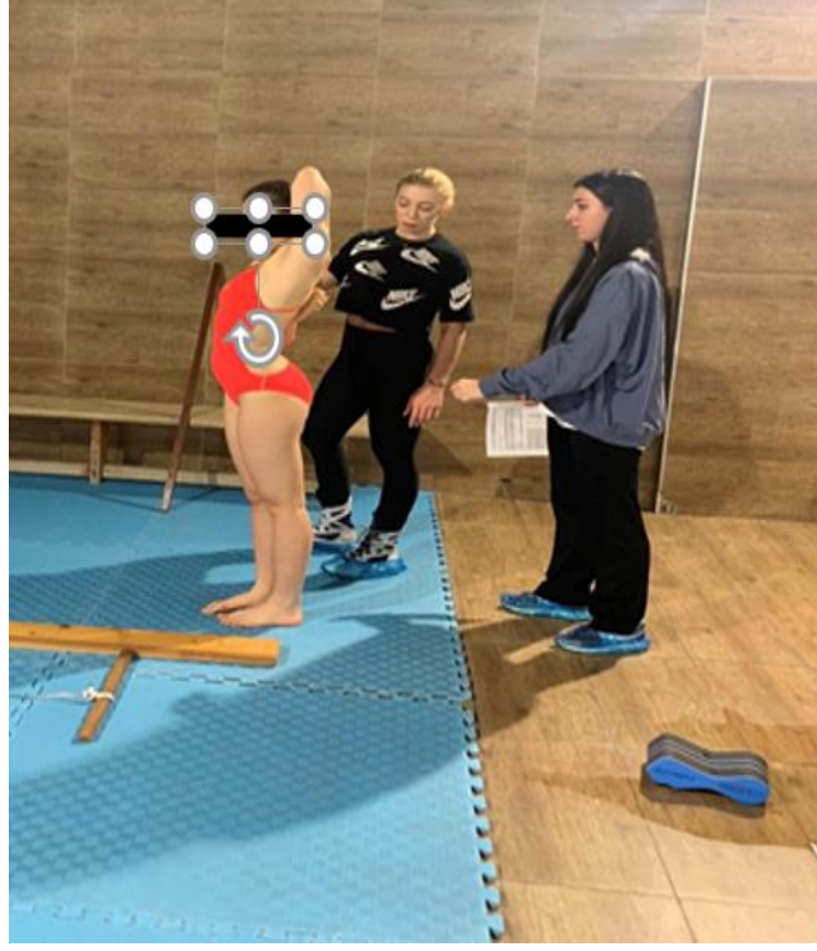
Resim 3.7: Omuz Mobilitesi