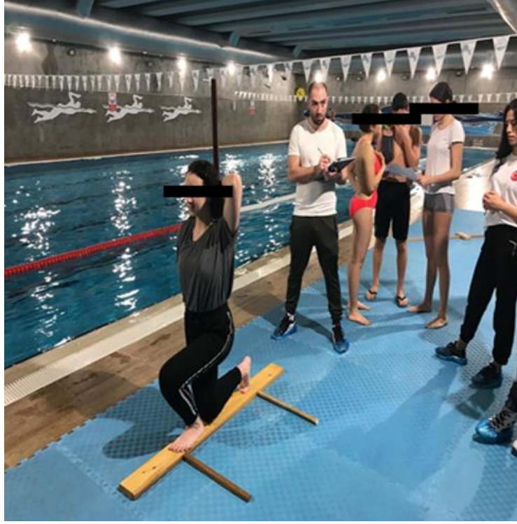
Resim 3.3: Tek Çizgi Üzerinde Lunge