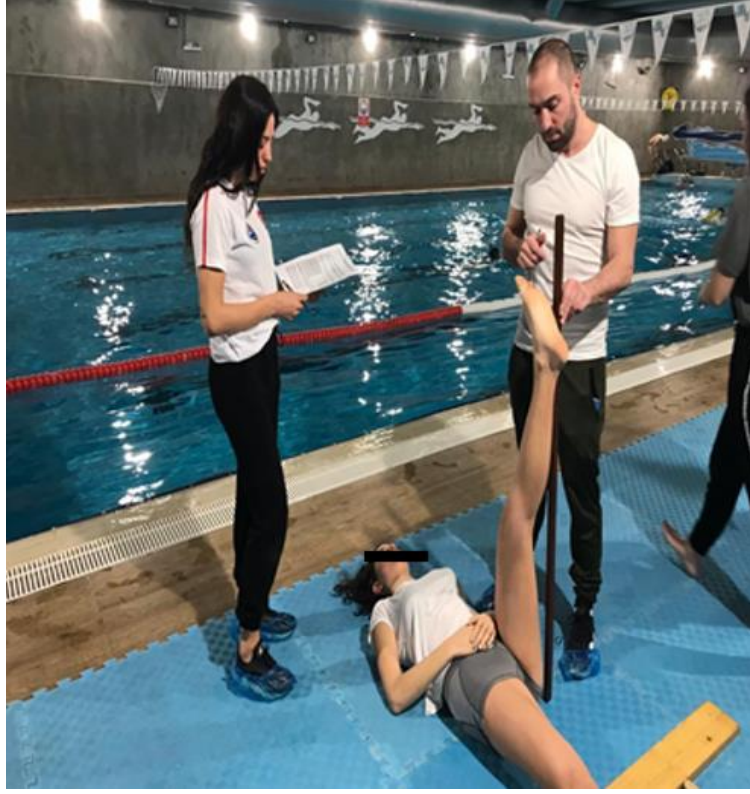
Resim 3.5: Aktif Düz Bacak Kaldırma