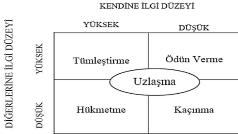
Şekil 2.1: Bireyler arası çatışma yönetim tarzlarına ilişkin iki boyutlu model

Rahim ve Bonomo tarafından geliştirilen, bireyler arası çatışma yönetim tarzlarına ilişkin “kendine ilgi düzeyi” ve “diğerlerine ilgi düzeyi” olmak üzere iki boyutlu modelde (Şekil 1) tümleştirme, ödün verme, hükmetme, kaçınma ve uzlaşma olmak üzere 5 çeşit bireyler arası çatışma yönetim tarzı bulunmaktadır (Rahim ve Bonomo, 1979).